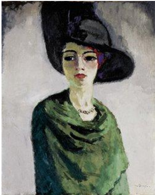
Lady in a Black Hat